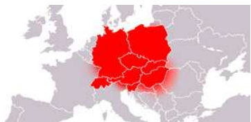
Fig. 6 – La Mitteleuropa di oggi

Dal 1 luglio 2009 il Distretto 2060 lascia la zona 12 (Italia, Albania, Malta e San Marino) per entrare a far parte della zona 19 che raccoglie alcuni paesi della Mitteleuropa. In particolare la zona 19 comprende la parte sud della Germania, l'Austria, l'Ungheria, la Repubblica Ceca, la Slovenia, la Croazia, la Bosnia, la Romania, la Moldova ed Israele.