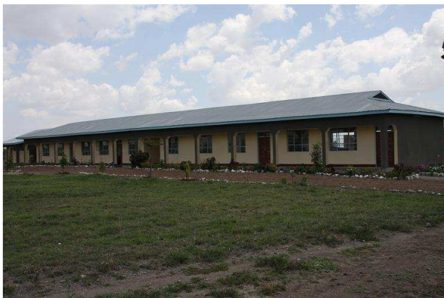
Fig. 4 – Edificio aule della scuola professionale di Bomang'ombe

La seconda sfida è trovare le risorse per retribuire gli insegnanti capaci necessari. Molti studenti e studentesse provengono, infatti, da famiglie povere che non possono contribuire in nessun modo al sostentamento della scuola.