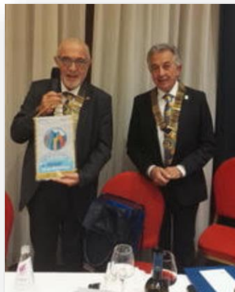
Il Governatore consegna il guidoncino Distrettuale dell'anno 2017-18