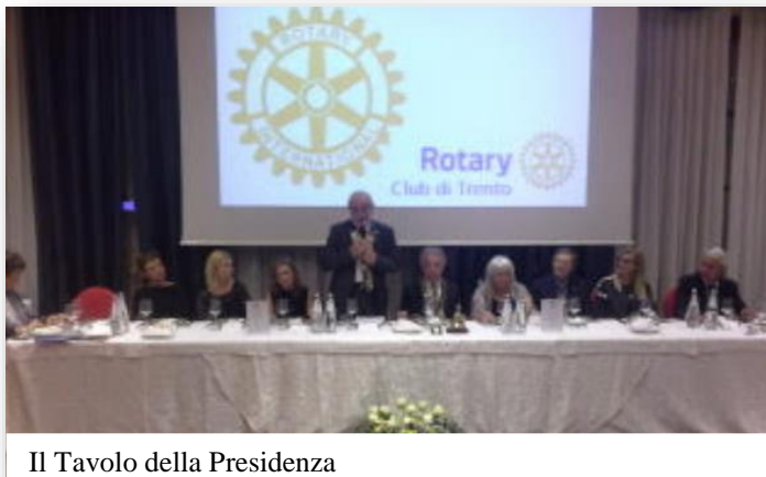
Il Tavolo della Presidenza

segno del loro profondo coinvolgimento nel Rotary. Letto poi il Curriculum Vitae del Governatore