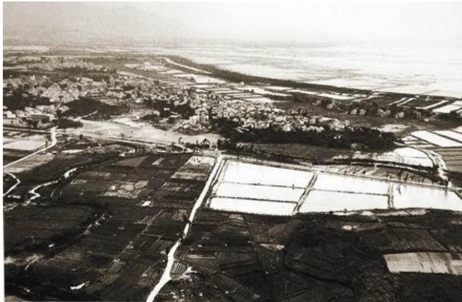
Shenzhen nel 1980

Nell'interessantissima relazione Enrico tratteggia con chiarezza il tema dello sviluppo della Cina in questi ultimi dieci anni, ed in particolare della città di Shenzhen dove sono dislocati gli stabilimenti. Tale periodo coincide con la nascita e la crescita dell'Industrie Zobele. Si proietta poi nel futuro indicando le strategie economiche, sociali ed istituzionali messe in campo attraverso il piano quinquennale 2011/2015 dal Governo cinese.