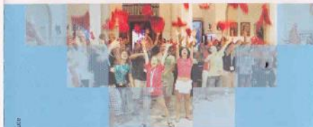
Progetto grafico realizzato da Orizzonti di Luce

Destinando il tuo 5x1000 nella Dichiarazione dei redditi fornendo il nostro codice fiscale: 94031290227