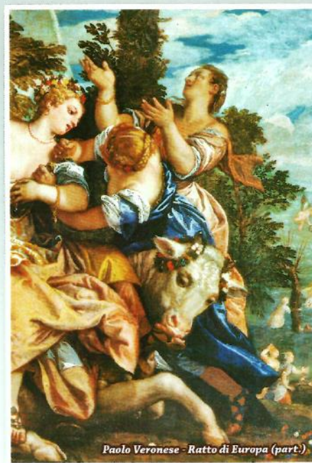
Paolo Veronese - Ratto di Europa (part.)

Mostra documentaria e incontri sull'argomento ottobre - novembre 2014