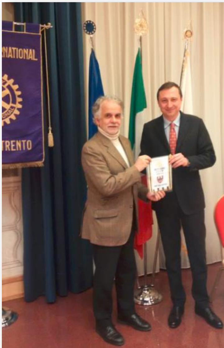
Relatore e gli omaggi del Club.