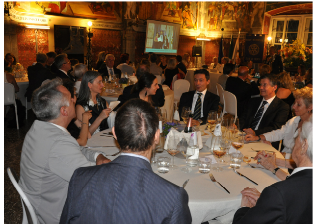
I tavoli dei Soci ed ospiti