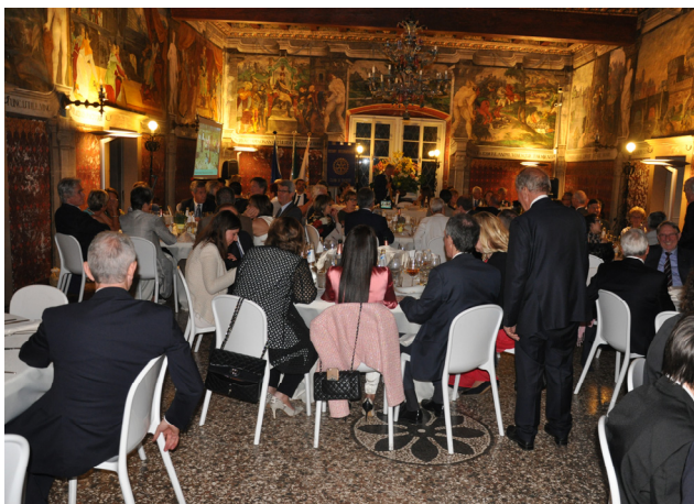
La splendida sala di Villa Margon