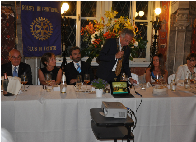
Il Presidente Frattari introduce la serata