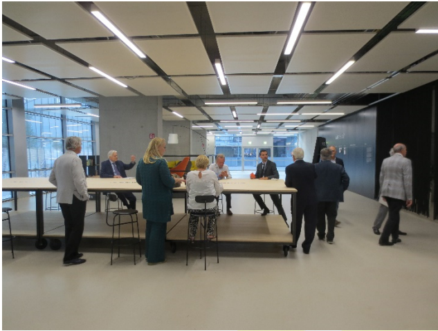
Una delle sale incontri