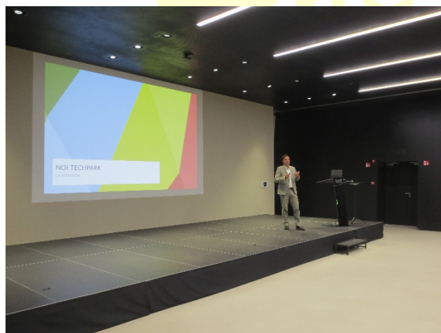
Presentazione del NOI