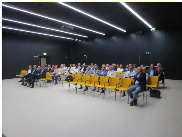
Sala eventi con i partecipanti RC