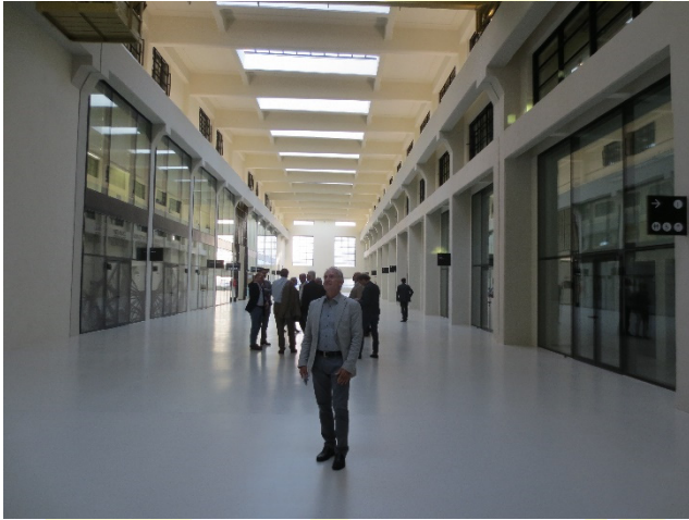
Architettura tra passato e presente