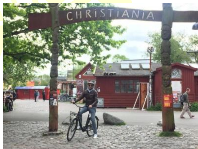
Città Libera di Christiania