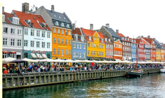
Canale Nyhavn – antico porto di Copenhagen