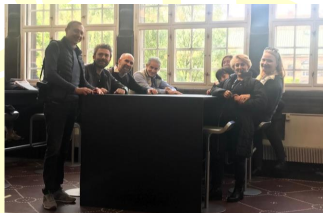
Royal Danish Library