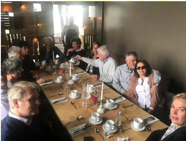
Cena nei Giardini di Tivoli