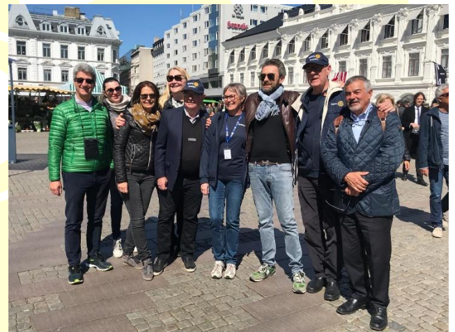
Incontro con il RC svedese di Malmö