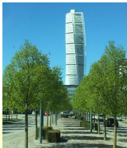
Palazzo Turning Torso a Malmö