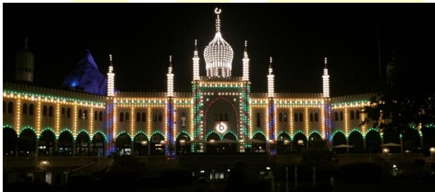
Giardini di Tivoli