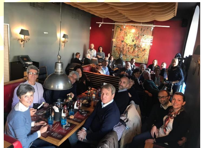
Pranzo a Malmö