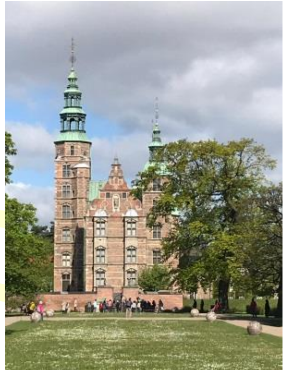
Castello di Rosenborg