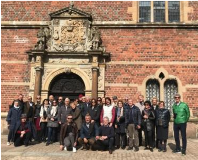
Castello di Frederiksborg