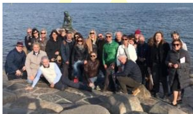
Foto di gruppo di fronte alla Statua della Sirennetta