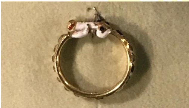
Castello di Rosenborg - Gioiello della Corona