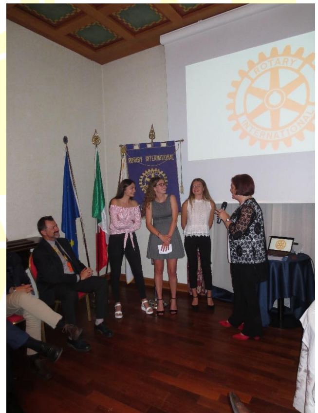
A titolo della classe 4SB del Tambosi: "Abbiamo cercato di riassumere in un breve video tutte le cause nelle quali Rotary è impegnato"