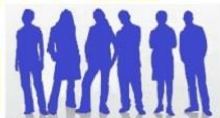
Premio Rotary per i giovani

Il premio rappresenta l'opportunità stabile e duratura per tutti gli studenti delle Scuole secondarie di secondo grado della Provincia Autonoma di Trento - Licei, Istituti tecnici, Istituti professionali- per parlare di Rotary e dei suoi valori universali: "Fare del bene nel Mondo" .