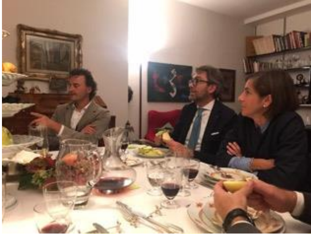
Momenti della discussione a casa Dusini.

Si è poi discusso sull'opportunità di riservare alcuni incontri ai soli soci del Club, senza la presenza di ospiti e relatori. Questo consentirebbe di avere un momento di vero club ma deve essere gestito per non correre il rischio che, dopo il caffè, i soci scappino a casa. È stato anche evidenziato che il club è in continua evoluzione e, da un approccio tradizionale, in cui vi erano solo alcune serate speciali aperte ai coniugi e ospiti (che quindi venivano valorizzati) oggi, sostanzialmente, tutti gli incontri sono aperti anche agli "esterni". Si dovrebbe quindi trovare una formula che concili tradizione ed evoluzione del club.