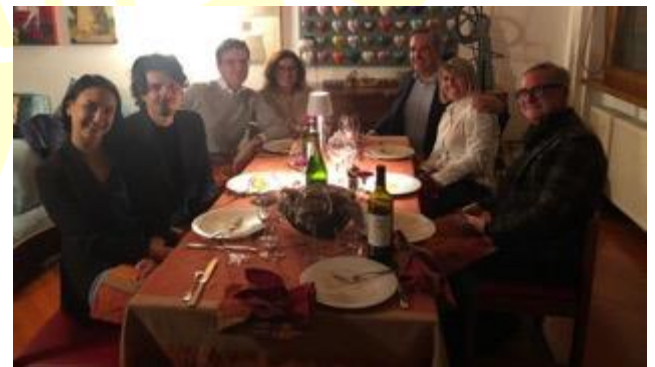
I soci rotariani a casa Pircher in compagnia degli ospiti RotarActioni.

Sia necessario istituire gruppi di lavoro per stimolare la partecipazione e la condivisione.