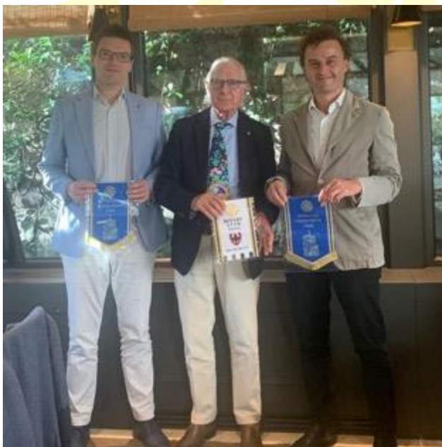
Lo scambio dei guidoncini