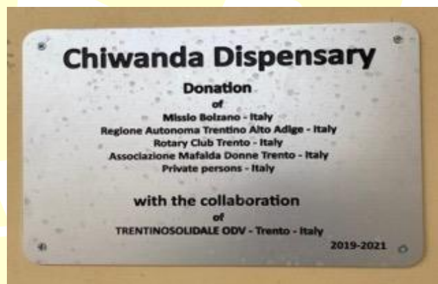
La targa con i finanziatori dell'opera

Il dispensario, terminato da un anno e mezzo, è stato inaugurato solo ora che sono cessate le limitazioni dovute al Corona Virus. Ha dato la benedizione il M.R. Dott. Beatus Urassa, Vescovo della Diocesi di Sumbawanga, alla presenza delle autorità sanitarie e governative.