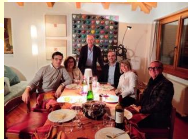
I soci rotariani a casa Pircher.

I pranzi potrebbero essere dedicati anche alle questioni rotariane.