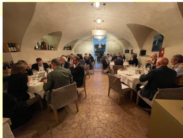
Vista d'insieme delle volte dello Scigno del Duomo.