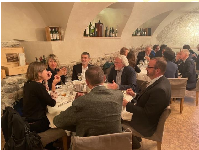
Momenti della conviviale.