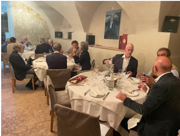
Momenti della conviviale.