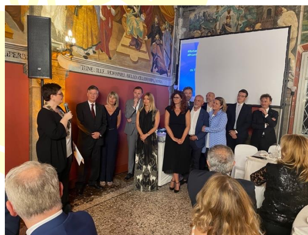
La squadra del RC Trento a.r. 2023-24