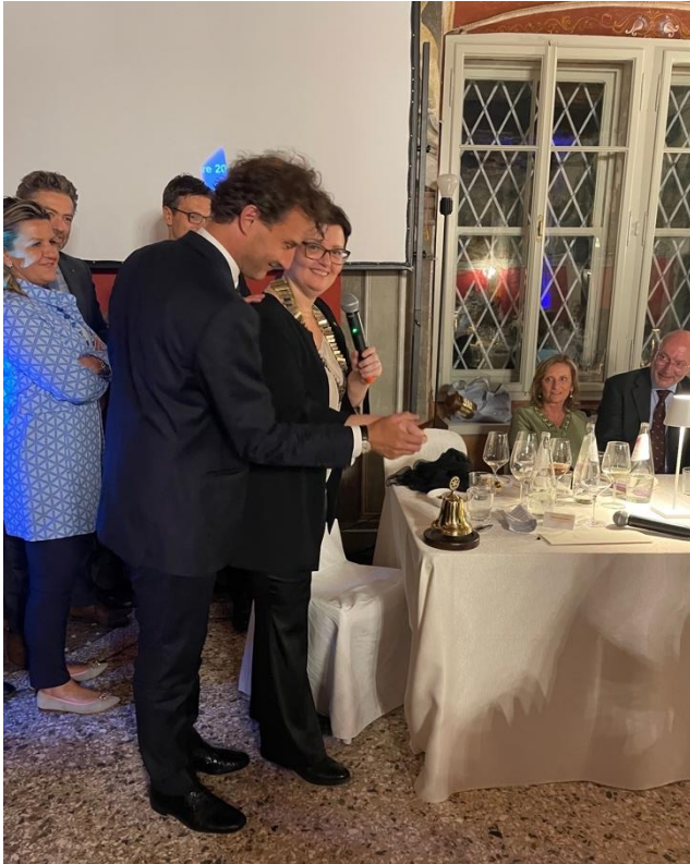
“Suonata a due mani”

Ultimo atto della serata: martellata alla campana a due mani