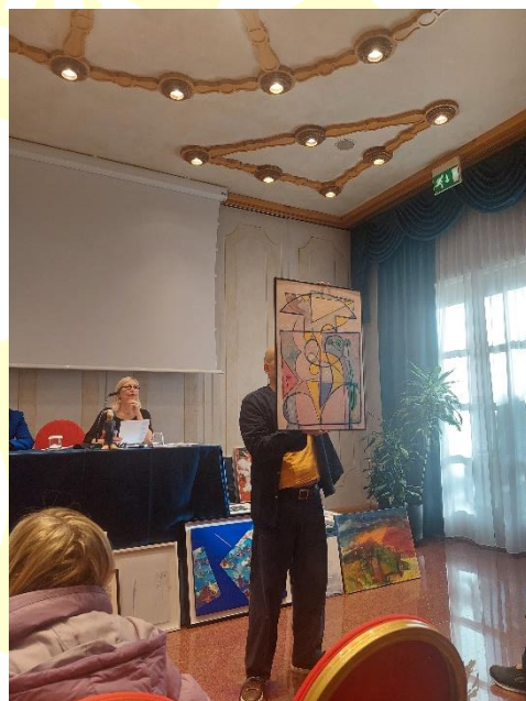
Sopra l’opera di Roberto Codroico