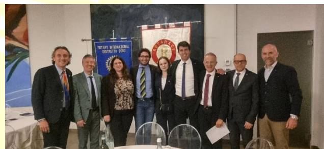
Alcuni Assistenti incoming e Presidenti incoming di Rotary e Rotaract

Questo service non è giunto alla completa definizione ed avrebbe bisogno di ulteriore apporto da parte dei Club. Alla serata sono stati invitati tutti i Presidenti e Presidenti Incoming dei RC Trentini.