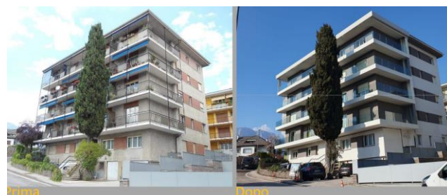
Condominio Spalliera - Trento (TN)

Si tratta di un condominio a Trento, dove sono state utilizzate tecniche avanzate come materiali isolanti a bassa conducibilità per mantenere la superficie utile dei balconi, garantendo al contempo l'efficienza energetica. Inoltre, sono stati implementati sistemi di ventilazione puntuale per migliorare la qualità dell'aria negli ambienti interni.