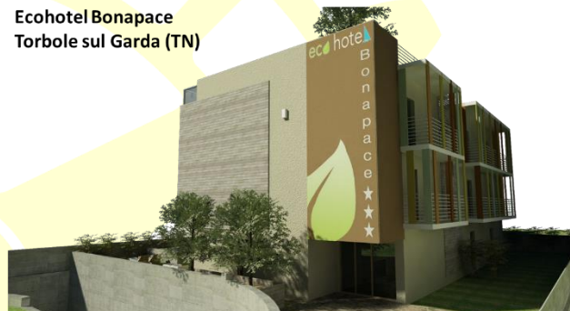
Ecohotel Bonapace Torbole sul Garda (TN)

Un esempio di eccellenza nel settore è un albergo a basso impatto energetico situato a Torbole, che ha ottenuto importanti certificazioni come CasaClima Hotel Gold. Questo edificio è progettato per massimizzare gli apporti solari in inverno e minimizzare il calore in estate, utilizzando soluzioni come balconi sospesi per evitare ponti termici. L'albergo, con una gestione intelligente del riscaldamento e raffrescamento tramite travi attive, garantisce comfort agli ospiti con un consumo energetico molto basso: solo 3€ per stanza al giorno. Grazie a queste innovazioni, la struttura è stata premiata come uno degli hotel più efficienti a livello mondiale.