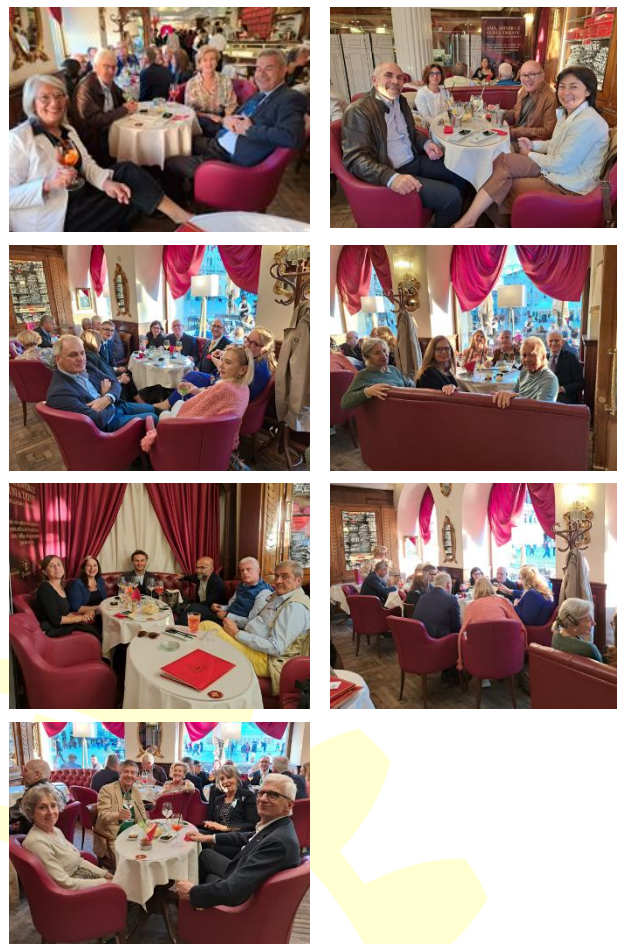
La sosta al Caffè degli Specchi

Nel pomeriggio partenza per il ritorno a Trento.